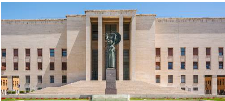
Sapienza University of Rome založená Bonifáčom VIII.

u r č i t e nebola tam kde je ani na poli svetskej vzdelanosti, technológií, u m e n í a podobne.