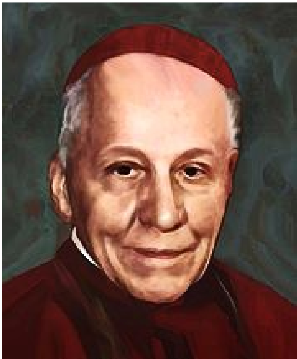
KARDINÁL JOSEF BERAN 29. PROSINCE 1888 - 17. KVĚTNA 1969