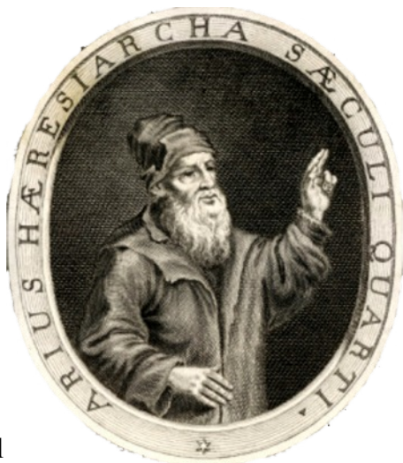
Arius (256 - 336)

Arianizmus chybné chápe záznam o tom, že Ježiš bol unavený (Ján 4:6) a že nevie dátum svojho druhého príchodu (Matúš 24:36). Áno, je ťažko pochopiteľné, že Boh môže byť unavený alebo že niečo nevie, ale nie je východisko na základe toho tvrdiť, že Ježiš bol stvorený. Ježiš bol Bohom, ale bol aj človekom. Ježiš sa nestal človekom, až pokiaľ nebol vtelesnený. Takže obmedzenia Ježiša ako človeka nemajú vplyv na Jeho božskú prirodzenosť.