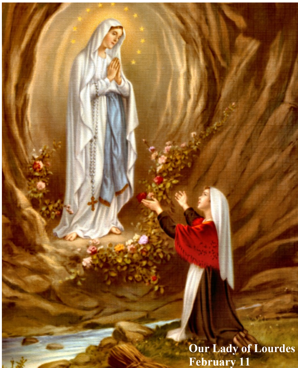
Our Lady of Lourdes February 11