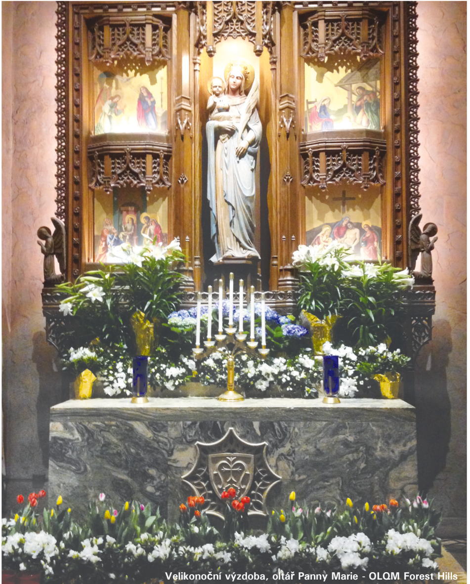
Velikonoční výzdoba, oltář Panny Marie - OLOM Forest Hills